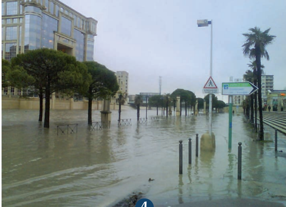
Inondation du Lez à Montpellier (Hérault).