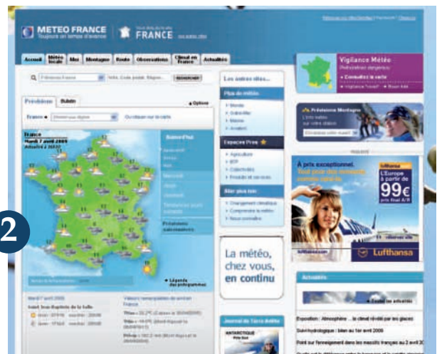
Page du site Internet de Météo-France : www.meteofrance.com